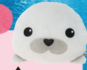
▲ 물개 페이스 쿠션