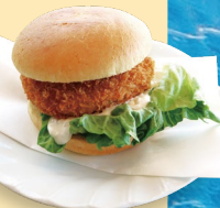
▲ 황새치 멘치까쓰 버거