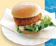
▲メカジキメンチカツバーガー