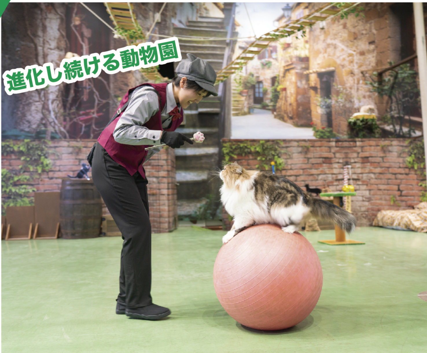
帰ってきたネコのパフォーマンス「ザ・キャッツ」！