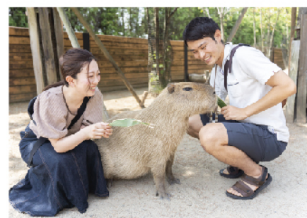
カピバラなど人気動物にエサやり体験や、ふれあいも充実。子供から大人まで楽しめます

動物のパフォーマンスとふれあい、エサやり体験をしながら1日楽しめて学べる動物園。毎日開催しているパフォーマンスは動物本来の動きや知能の高さを引き出しお客様へ驚きと感動をお届けします。ジャングルや熱帯の湿地、アジアの森をイメージした室内施設も充実しているので悪天候時も安心して楽しめます。