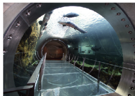
360°パノラマのチューブ型トンネル水槽から見る大迫力のアマゾン大水槽

栃木県唯一の水族館「なかがわ水遊園」は、「那珂川」をテーマにした水と緑と魚のテーマパークです。那珂川から世界の川そしてあこがれの海へ、330種2万尾の魚たちで表現する水族館をメインに、25haの広大な園内には釣り体験ができる「つり池」や小さな子どもでも楽しめる「水の広場」や「アスレチック遊具」などの施設があります。