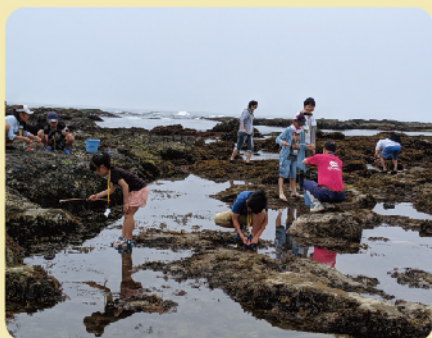
バッコ（小魚）釣り体験の様子

ウミガメの産卵調査や、ケガをした生物の保護・治療を行い野生復帰を目指す取り組みを行っています。