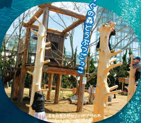
えもんのまごがせ / ヤブツツの木