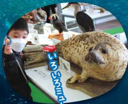
シーホークシアターゾウム