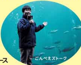
ごんべえズトーク