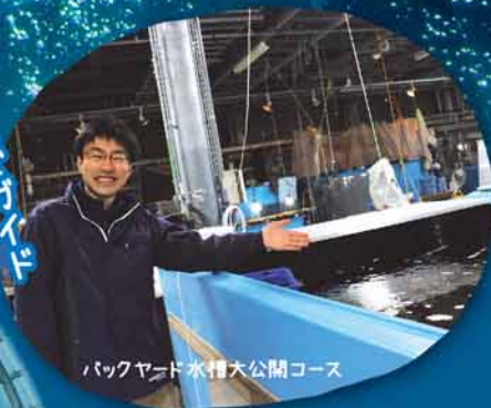
エンベレスガイド