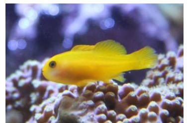
キイロサンゴハゼ