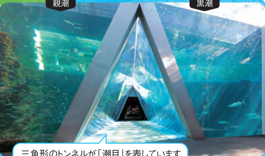
三角形のトンネルが「潮目」を表しています

2F 親潮 アイスボックス 小さいけれどユニークで色鮮やかな生き物たちを宝箱のような水槽でご紹介します。